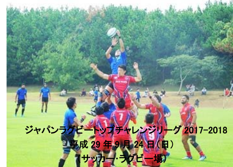
ジャパンラグビートップチャレンジリーグ 2017-2018 平成 29 年 9 月 24 日(日) (サッカー・ラグビー場)