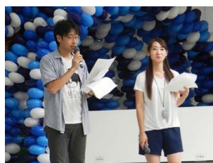
大会に参加された皆さん、おつかれさまでした!!